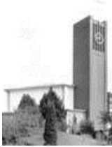
St. Maria Frieden

32. Sonntag im Jahreskreis – 10./11.11.2018