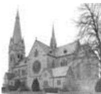
St. Peter und Paul