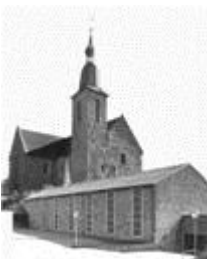
St. Johann/ St. Marien

Markus 12,38-44 - Wenn Jesus aufs Geld zu sprechen kommt, wird es schwierig. Er setzt nicht nur die uns bekannten Gesetzmäßigkeiten und Regeln außer Kraft, sondern agiert geradezu unvernünftig. Er lobt allen Ernstes die arme Witwe, die alles spendet, was sie hat, ihren ganzen Lebensunterhalt. Und die dadurch zur Empfängerin dessen wird, was die Reichen freigebig und reichhaltig geben und dafür von Jesus auch noch getadelt werden.